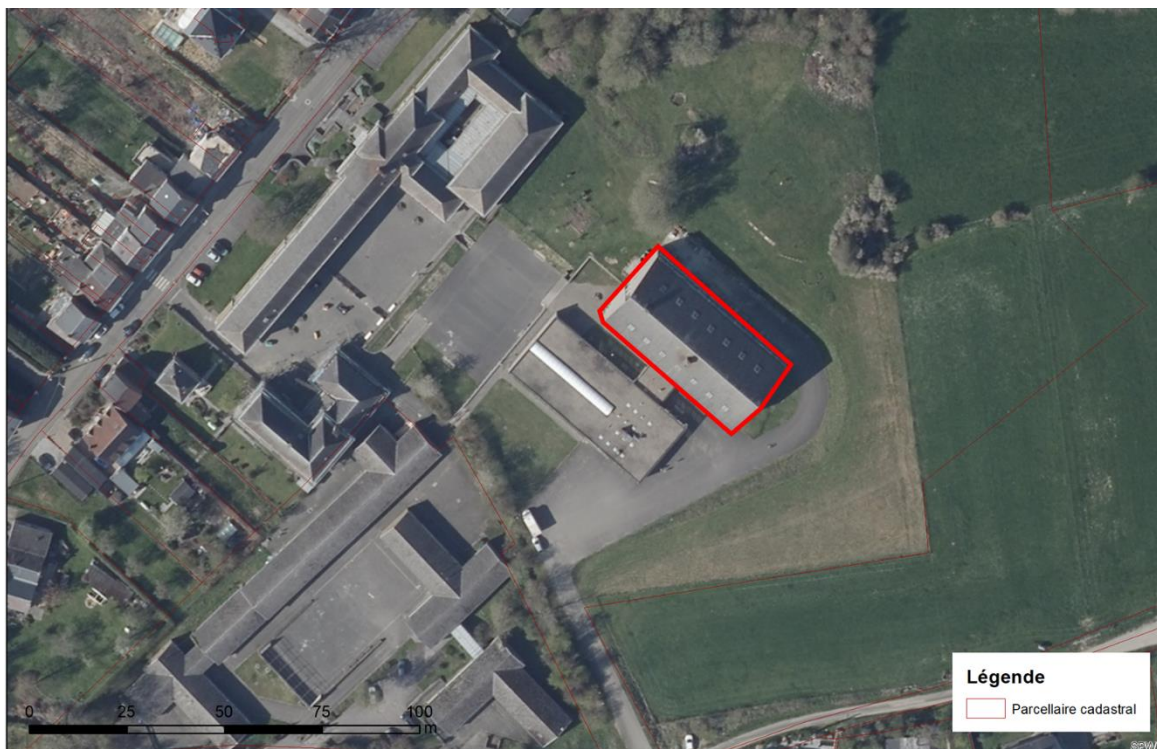
Localisation du bâtiment sur le site de Fraire – vue aérienne

Le choix de la CLDR pour la localisation du projet s'est porté sur le grand bâtiment de l'ancienne école secondaire situé sur le site de Fraire (voir photo ci-dessous). Ce bâtiment possède une bonne localisation, il est situé à environ 500m du centre de Walcourt. Il jouit également d'une bonne accessibilité en transport en commun puisqu'il est situé à 1km de la gare de trains et de bus. L'arrêt de bus le plus proche se situe à 500m (arrêt du passage à niveau). De plus, le site est doté d'un grand espace de stationnement.