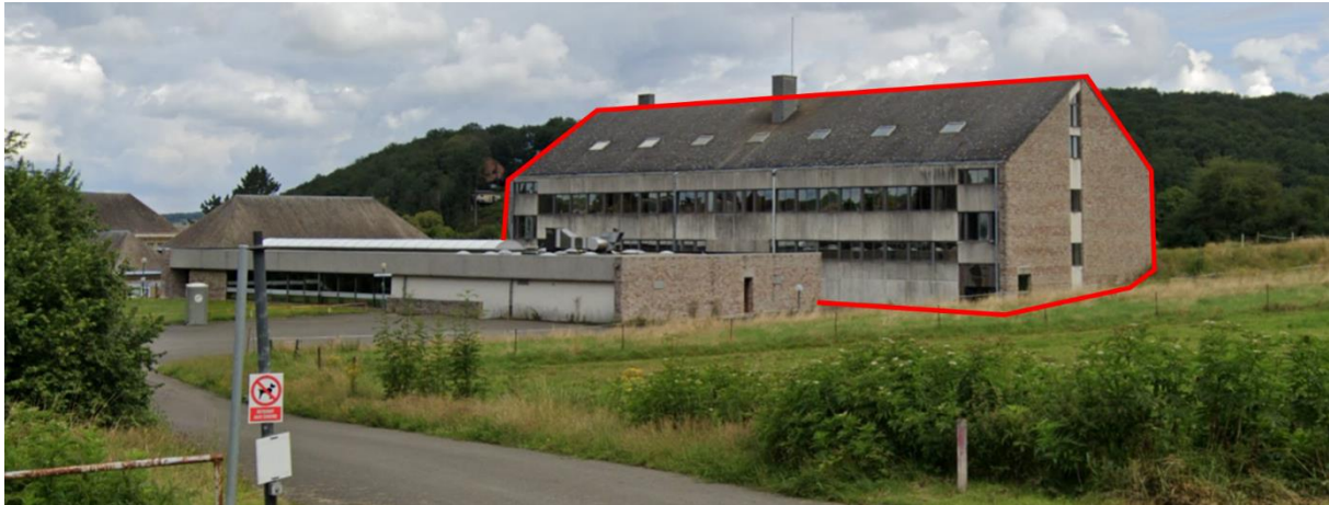
Bâtiment du Pôle emploi formation création

De plus, le service « Pôle emploi, formation, création » est encore situé dans le bâtiment à côté..